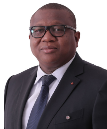
Amadou Coulibaly Ministre de la Communication et de l'Économie Numérique

A stylized, handwritten signature in black ink, appearing to read 'Amadou Coulibaly'.